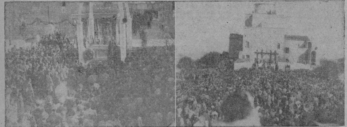
Aspecto parcial de la plaza de Villafranca durante la alocución del Prelado y una vista del monasterio de Bonany durante la celebración de la magna concentración mariana.