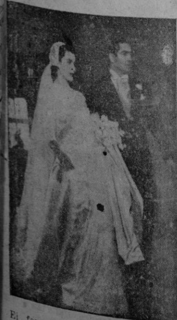
El famoso actor Tyrone Power, de brazo de Linda Christian, sale de la iglesia de Santa Francesca, donde contrajeron matrimonio.

Anoche estuvo reunida para tratar de la contestación a la nota soviética la comisión parlamentaria de Asuntos Exteriores y Defensa, en la que no tienen representación los comunistas, y también hubo Consejo de Ministros con igual objeto.