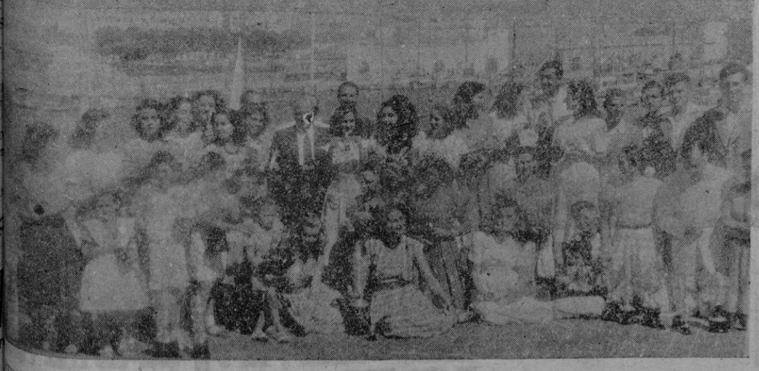
Presidente del Club Náutico Sr. Fortuny con un grupo de asistentes a la entrega de los trofeos de las últimas regatas