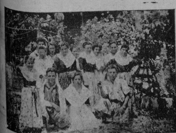
El grupo folclórico de San Juan que actuó con gran éxito en las fiestas de Villafranca