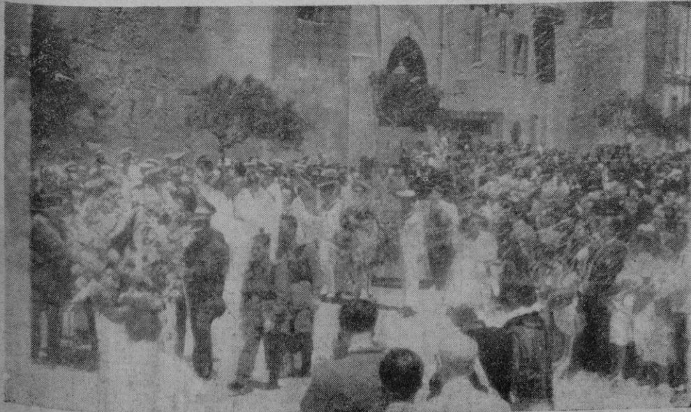
Aspecto que ofrecían los alrededores de la Cruz de los Caídos durante el acto de la colocación de coronas