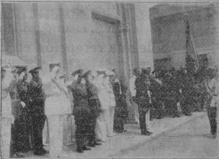
Las autoridades que asistieron a la solemne misa celebrada en la Iglesia de los PP. Carmelitas, presenciando el desfile de las fuerzas