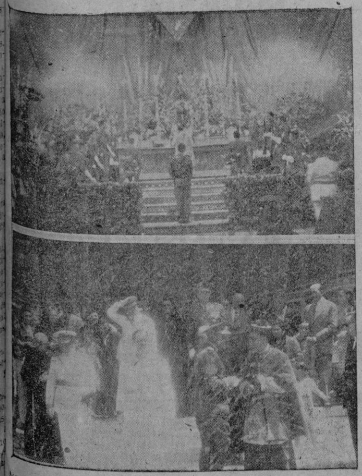
Aspecto del altar mayor durante la misa del domingo en San Francisco y las autoridades a la salida de la basílica.