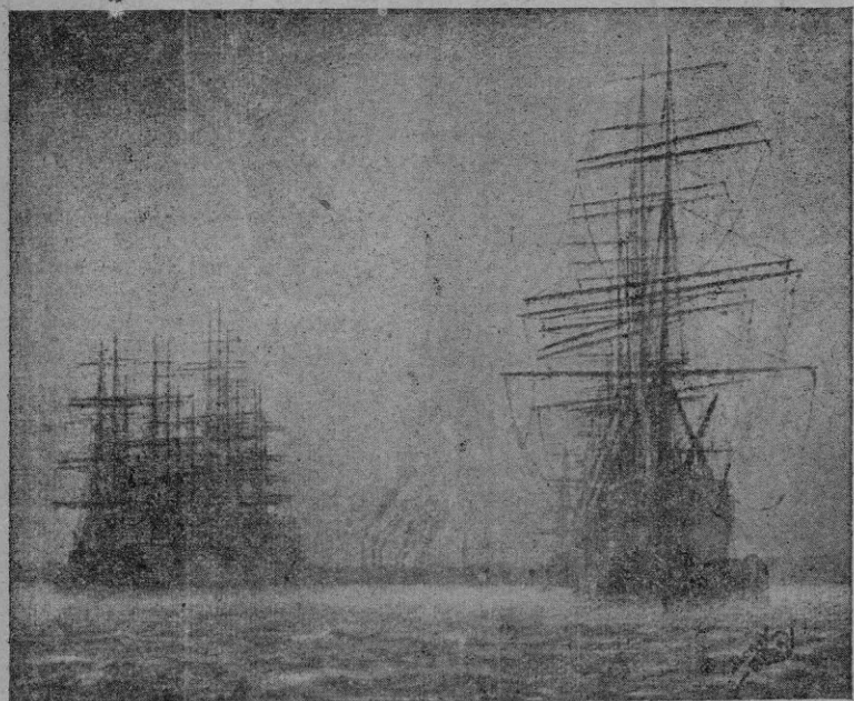
A. Bonet Ribas, "Brumas"

Su labor ya se comprenderá, no obs ante, que es de mano callosa, artística cuando se aparta de estos minuciosos y enojosos recuerdos