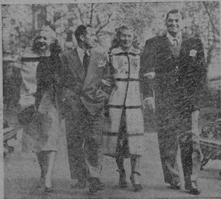
Londres. — Johnny Weismuller (derecha) con su esposa y unos amigos, pasean por la capital británica, donde participará en una exhibición de salud e higiene