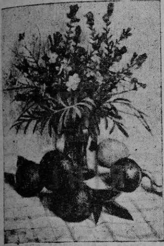
Oleó de Corominas

COROMINAS (Galerías Costa). —Lo mejor de la obra de este pintor humilde está, tanto en la ejecución sencilla, como en esa especie de cosa rancia que queda flotando en sus cuadros, involuntariamente.