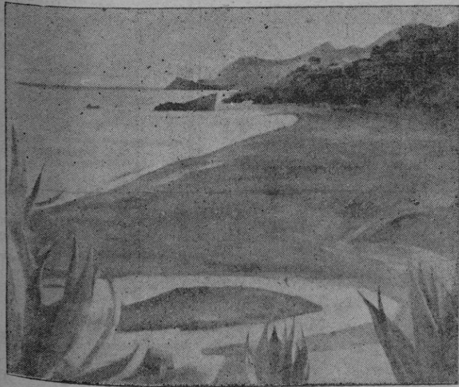
Una de las obras de Conrad Liesegang

Tomen una muchacha con el pelo perfumado, un hombre que no se fie de las mujeres... Tomen una canción de gran éxito; agreguen a HUMPHREY BOGART y LIZABET SCOTT, mezclando y habrán conseguido una magnífica combinación: