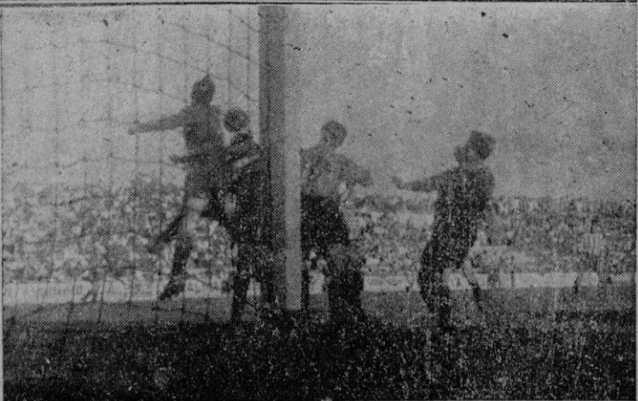
El equipo del Coruña; abajo, un barullo sin consecuencias ante la puerta del Coruña