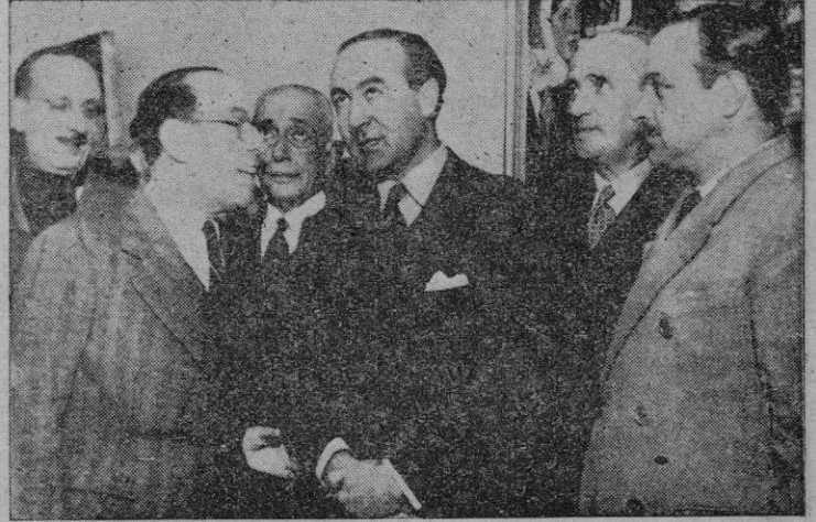
Buenos Aires.—El embajador de España, señor Arellano, acompañado de diversas personalidades, asiste a la inauguración de las nuevas oficinas de la Cía. Iberia de Aeronavegación