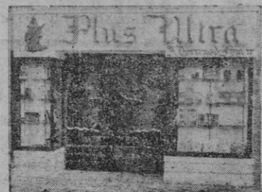
Plaza Sta. Catalina Thomás, 10 Palma de Mallorca

Es el núm. 34 de las Ediciones de Conferencias y Ensayos, de Bilbao y uno de los más interesantes publicados, encontrándose de venta en las principales librerías al precio de 3 pesetas volumen.