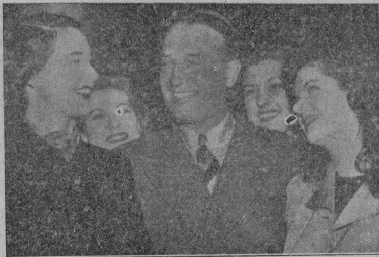
La sonrisa de Maurice Chevalier parece encandilar todavía a estas cuatro bellezas que rodean al popular galán, que ha cumplido ya los 57 años

Nokrashy Bajá no aclaró si piensa presentarse al mismo ante el Consejo.—Efe.