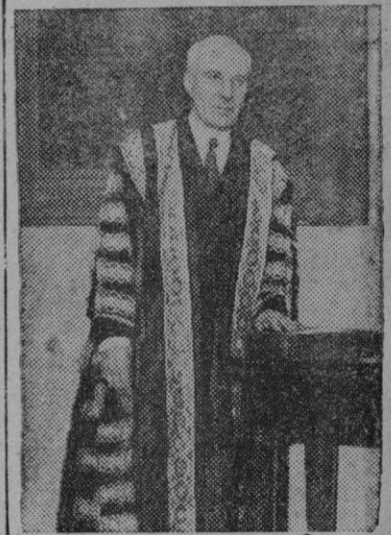
Mr. Hugh Dalton, Ministro de Hacienda británico fotografiado por primera vez en traje de ceremonia

claró abierto el Consejo con los gritos de ritual. Por a tarde en el Ayuntamiento continuarán las sesiones.