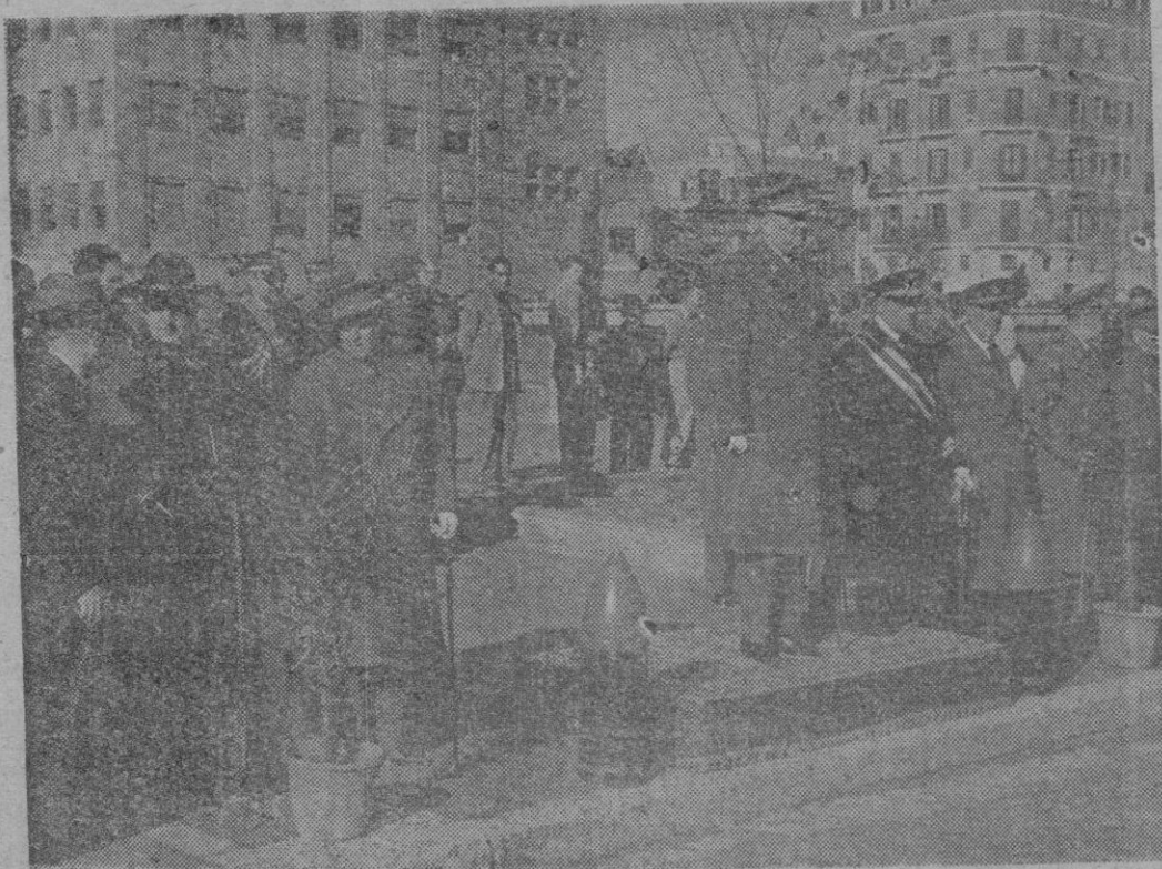
En la foto vemos al Capitán General, acompañado del Sr. Obispo de la Diócesis, Gobernador Civil y Jefe Provincial del Movimiento (con uniforme de General de Artillería), Almirante Jefe de la Comandancia General de la Base Naval de Baleares, General Jefe de la Zona Aérea, General Gobernador y General Subinspector de Tropas, que, con otras autoridades, presidieron el desfile de las fuerzas que rindieron honores, con motivo de la festividad de Santa Bárbara, Patrona de la Artillería — (Información en tercera página)