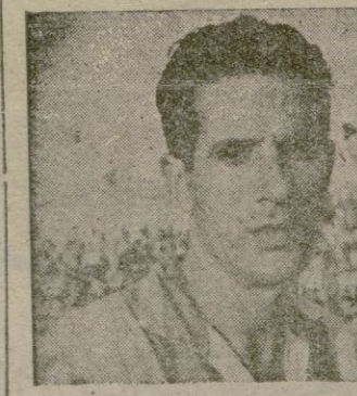
GERMAN el preparador y jugador de los menorquinistas

LA VENTA DE LOCALIDADES PARA EL PARTIDO DEL DOMINGO Hoy serán puestas a la venta las localidades para el partido «Atlético Baleares - Mallorca», que el próximo domingo ha de celebrarse en el campo de «Son Canals». El horario y lugares de venta, será el siguiente: Café Pasaje, de 10 a 2 mañana y de 4 a 6 tarde. Asistencia Palmesana, de 6 a 9 de la tarde.