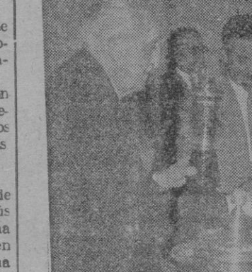
Un momento de la entrega de los trofeos, por el Ingeniero Jefe de Minas, a los Mineros que se distinguieron en el reciente festival celebrado con motivo de la Patrona Santa Bárbara.