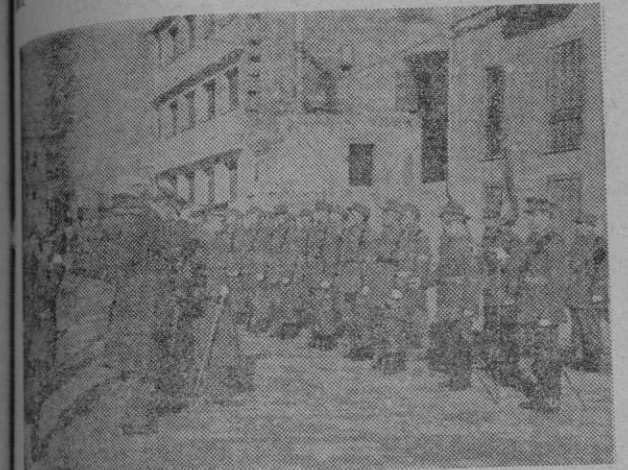
El capitán General y el General Gobernador Militar, saludando al estandarte, al pasar revista a la batería que rindió honores

los Ministros del Ejército, Teniente General Barroso; de Marina, Almirante Abarzuza; de Obras Públicas, General y Gón; y de Industria, señor Planell; y el capitán General señor Muñoz Grandes.