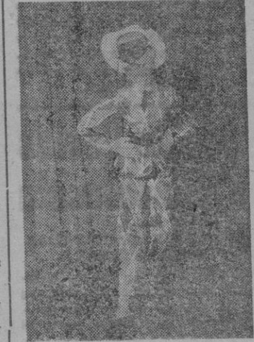
El Arlequín de los «Piccoli»

Las marionetas de Prodecca, desde hace ya muchos años, justifican los más encendidos elogios. Prodecca, con la creación de los Piccoli, que han seguido a través de los años a la cabeza de su género y en todo el mundo, hizo algo más que dar vida a unos muñecos de madera y trapo, hizo una auténtica creación poética dentro una línea de extraordinario humor.