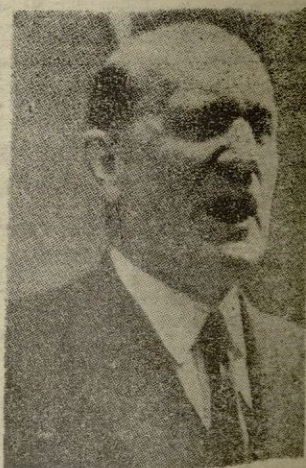
V. VICTOR PRADERA

en la intersección de su vida con su obra; en la confluencia de sus virtudes privadas y públicas, en lo que en su obra había de fidelidad a su pensamiento. Por eso su ademán tuvo siempre un eco popular y su actitud continúa aleccionando hoy. Verdaderamente que sus teorías siguen concitando un interés creciente pero su muerte reclama la unánime adhesión total de los españoles a una conducta como la suya, tenaz e ineludible hasta la muerte. Muchas cosas desaparecerán porque es ley natural el que las cosas humanas desaparezcan, pero el ejemplo de su muerte no pasará. Porque en el silogismo que rubricó con su propia sangre estaba escrito y afirmado el nombre de España. Y el de Dios.