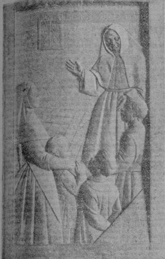
De nuevo el gran escultor Jaime Mir acaba de darnos nuevas pruebas de su talento artístico labrando el monumento que la villa de Sancellas dedica a la Venerable Sor Ana Maria Cirer y que se inaugurará, D. M. el próximo domingo. La foto es de uno de los cuatro relieves del pedestal, en el que se representa uno de los aspectos de la vida de la Venerable: la enseñanza del catecismo a los niños. El artista ha concebido la escena con un gran sentido de lo plástico. Las líneas, sobrias y firmes, del conjunto, convergen audazmente, mientras los planos, sabiamente escalonados, prestan equilibrio y adecuada profundidad a la composición. Otra gran obra de Jaime Mir, por la que le felicitamos muy cordialmente.