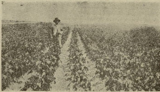
Campo de algodón en Andalucía

Si el labrador transforma tierras de secano en regadio o nuevas roturaciones en secano, puede reci-