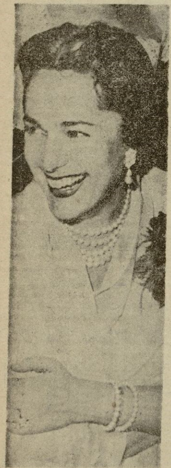
La Begun, una de las mujeres mejor perfumadas del mundo ha dado su nombre a varios perfumes.

Existe un arte de los aromas, tan digno de consideración como el de los sonidos dulcísimos o el