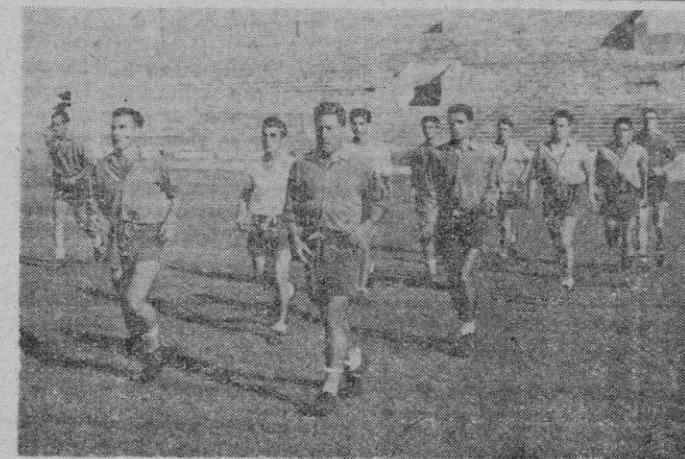
Y aquí tenemos al grueso del equipo practicando eso que se llama marcha atlética.

Sus compañeros le hacen poner como con un saco de cien kilos a la espalda recorrió dos kilómetros sin parar, sólo por ganar una apuesta. —Y esto no es nada comparado con la apuesta que gané en el muelle. Apostaron a que yo no era capaz de subir a bordo del barco cargado de tres sacos de harina con un total de casi trescientos kilos. —¿Ganó la apuesta? —No solo los subi sino que los volví a bajar. —¿Ha peleado alguna vez? —Creo que en mi vida no he pegado a nadie a no ser en legítima defensa. Dios me ha dado la fuerza para que la empleara en trabajar y no en pelear. Nuestra opinión hacia estos hombres es que bajo el disfraz de duros se encuentra un corazón tan sensible como el que más, verdaderos sentimentales a su modo, que en momentos dados, una apuesta, el compañerismo o una mujer, se juegan la fortuna física y hasta la vida misma.