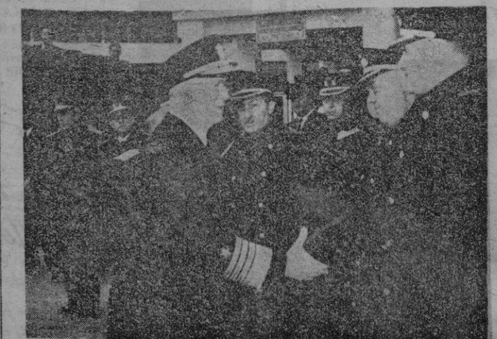
El Almirante de los Estados Unidos Robert B. Carney, saluda, a su llegada al aeropuerto de Barajas, a las personalidades que acudieron a recibirle