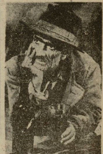
He aquí el único remedio contra la Bomba Atómica: el vino.

cabo, parece ser que la forma más eficaz del alcohol contra las armas atómicas se da en la forma del vino llamado vulgarmente "tinto". De esta forma, el organismo asimila mejor y más rápidamente los efectos alcohólicos y la inmunidad contra las radiaciones de energía nuclear es mayor. En un experimento hecho hace poco en un centro atómico inglés, se alimentó a una cabra durante un mes solamente con vino de la clase francesa llamada "Cotes du Rhone". Sometida a una fuerte radiación procedente de una pila atómica que hubiera sido capaz para ma-