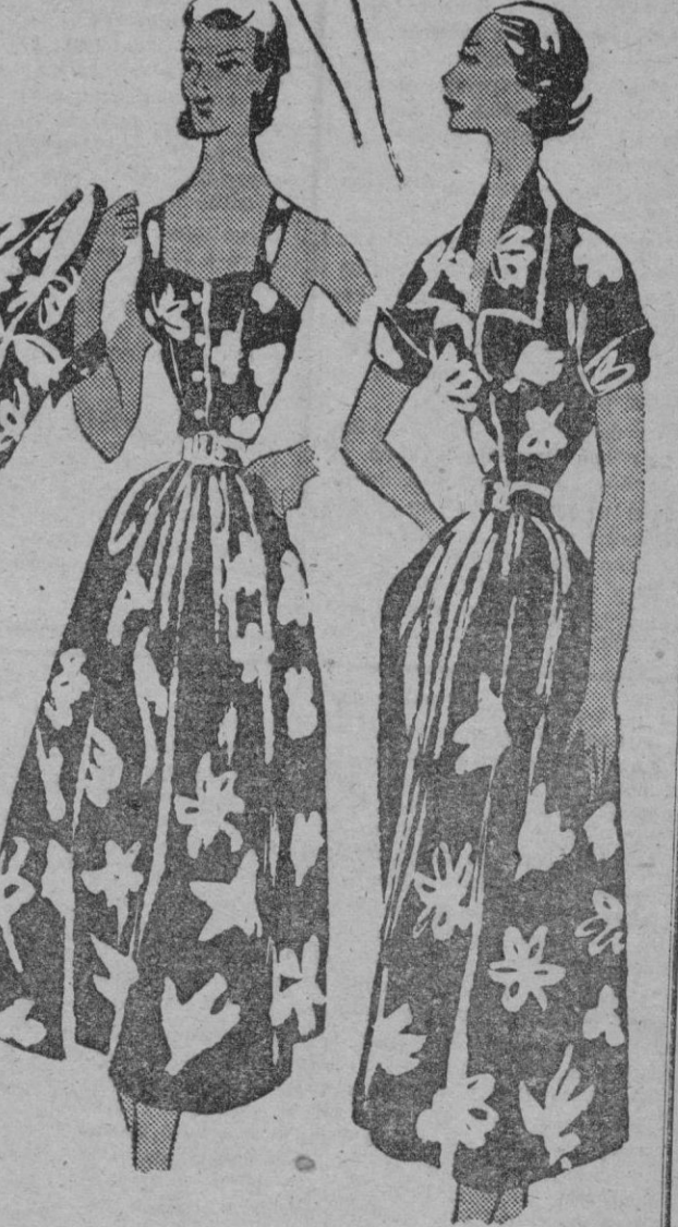
Lindo conjunto formado por una blusa sin mangas y falda de gran vuelo. Las dos piezas de la misma tela. Color azul oscuro. Vestido para playa; corpiño ajustado con botonadura hasta el talle y tirantes. Amplia falda. El tejido es de rayón estampado y va completado con una blusa de la misma tela. Vestido con manga corta, de rayón estampado, como el anterior. Cuello y mangas puntiagudas.