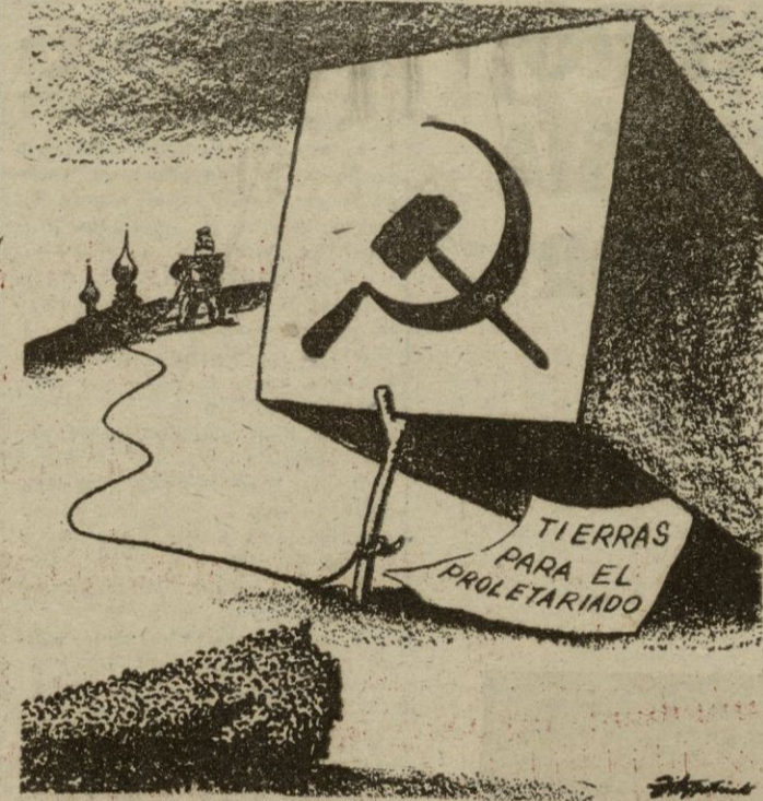
El periódico "St. Louis Post-Dispatch", de los EE. UU. publica esta caricatura alusiva al otorgamiento de tierras nuevas al proletariado ruso. No es sino una enorme trampa donde irán a caer, bajo un simple movimiento del Kremlin, millones de campesinos.

nista aun no le ha llegado la vez; pero sus subordinados están siendo detenidos. Malenkov, había confiado en él la realización de aquellas promesas de una vida mejor, con mesa abundante, que hicieran los rusos al subir al alto puesto que hoy ocupan. La realidad ha descubierto que todo era una ilusión. Y cuando las quejas de los hombres desperdigados por las granjas colectivas se hagan oír, Malenkov, tiene a la vista ya la víctima para calmarlas: será esta Khrushchev, que nadie sabe sabe como pagará tan funesto error.