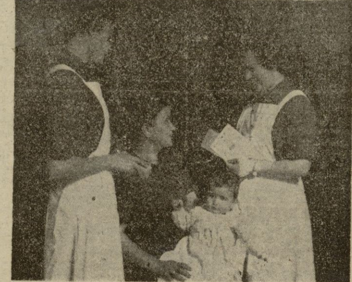
Das divulgadoras sanitarias de la Sección Femenina orientan a una madre sobre las medidas que debe adoptar para preservar la salud de sus pequeños

la Manuela está ya mejor que nunca. Lava toda la ropa en el río, como siempre, y va a por el agua a la alberca, lo mismo que antes. El muchacho parece un cachorro, de gordo y majo..."