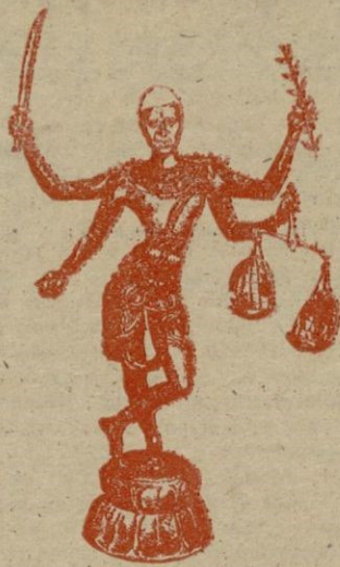
El Pandit Nehru en alegoría

Por otra parte, dentro de la India portuguesa no hubo el menor asomo de manifestaciones contra la soberanía portuguesa y, por el contrario, los residentes en aquellos territorios aplicaban la mano así que les era posible y aprovechando cualquier descuido de la Policía propia, a los voluntarios venidos de fuera que les atrapaban.