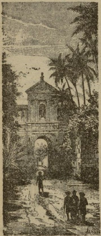
La puerta de Nuestra Señora de la Sierra, una de las cuatro que guardan la vieja ciudad de Goa. Fue construida por Alfonso de Albuquerque

El ministro Paulo Cunha, sin un remolón, sin la más ligera vacilación, ha contestado explícita y hondamente, a cuantas preguntas se le han hecho. En la sala de conferencias no se dió la clásica rueda de Prensa debido a la cantidad de periodistas presentes; pero situados en forma de hemiciclo, cerraron Paulo Cunha, que sentado en la mesa entre altos funcionarios de su Ministerio, afrontó impávido cuantas intrórganter se le plantearon. En la conferencia se puso de relieve la satisfacción del pueblo portugués y de sus gobernantes por el hecho de que en el día crucial de Goa