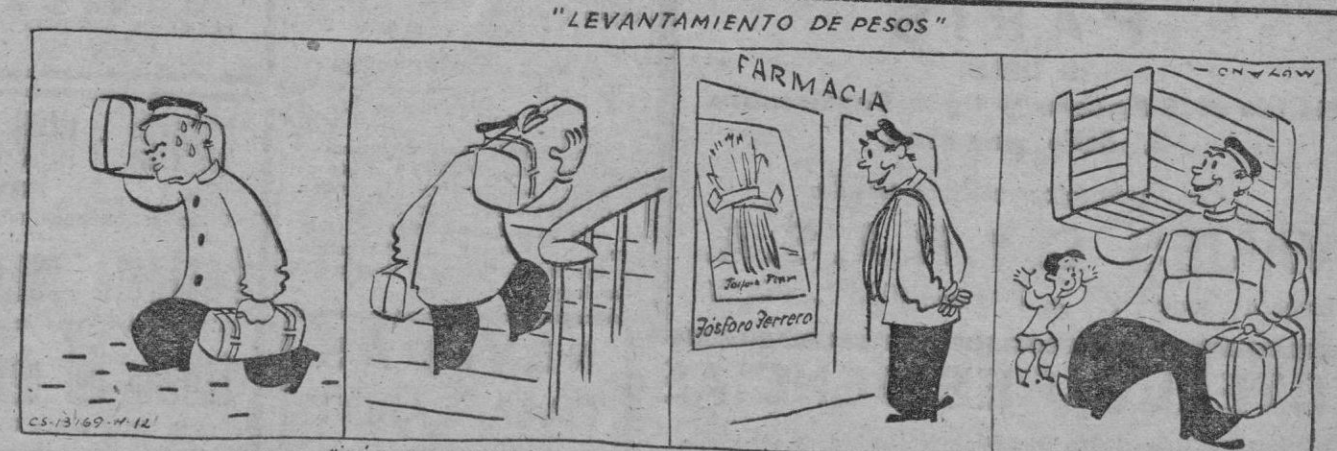
TOME "FÓSFORO FERRERO" Y SERÁ SIEMPRE EL PRIMERO

Delegación en PALMA DE MALLORCA: Héroes de Manacor, 38, 1.º PRACTIQUE NUESTRO MODERNO Y BENEFICIOSO SISTEMA DE AHORRO Texto autorizado por la Dirección General de Seguros y Ahorro, con fecha 17 marzo 1951