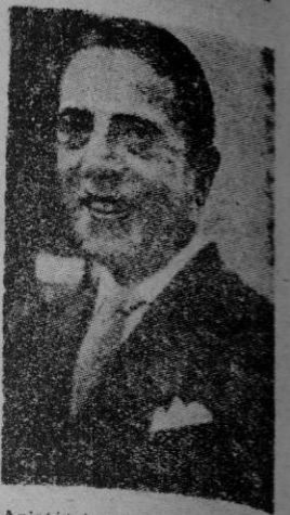
Aristóteles Sócrates Onassis

El ciudadano griego domiciliado en Montecarlo Aristóteles Sócrates Onassis está en un grave aprieto. Las autoridades norteamericanas han iniciado un proceso contra él. El ministro norteamericano acusa a este hombre, uno de los más ricos del mundo, de haber adquirido como "surplus" puesto a la venta una enorme cantidad de material de guerra americano. Este cargamento de material solamente lo pueden comprar, según la ley, ciudadanos estadounidenses. Claro que en el fondo de toda la cuestión hay quien asegure que el crimen de Onassis no consiste en esta compra, sino en haber construido a base de este material una flota de buques tanques con la cual realiza una competencia peligrosa a las sociedades americanas de petroleros; el rey de la Arabia Saudita acaba de concluir con el griego un contrato dándole el monopolio para todos los transportes de petróleo que no caben ya dentro de la competencia de las cuatro sociedades petrolíferas americanas que trabajan en su reino.