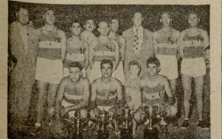
Equipo del Maestranza Aérea de Baleares con los trofeos conquistados

MAESTRANZA: Esterich; J. (Continúa en la pág. sig.)