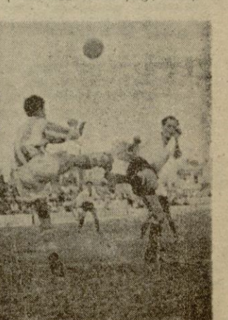
Así, con tacto y sin mala intención jugaron los equipos del Constancia y Atlético Baleares

dos, que sean el Constancia y el Mallorca quienes diriman la posesión del Trofeo Copa Presidente y así el At. Baleares no se ha decidido ni por el uno ni por el otro, ha estado en el fiel, contribuyendo igualmente a que un desempate