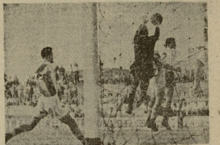
Una buena intervención del meta del Constancia evitando un remate de Turro.

gocio es que aconteciera lo que sucedió. Es decir, que el Atlético Baleares ganando perjudicaba al Constancia y favorecía al Mallorca y lo propio sucedía empatando. Una postura normal es ésta: jugar el partido con las disponibilidades de jugadores que se tenían y ahora en buena lid, que desempaten los que están empa-