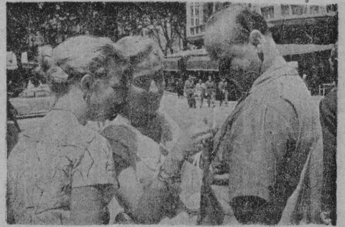
Una bella noticia gráfica de la fiesta de la "banderita" la dieron dos guapísimas postulantes — dos, entre tantísimas como animaron el día de ayer en Palma — captadas en el instante de condecorar con una bandera y dos sonrisas a un extranjero.