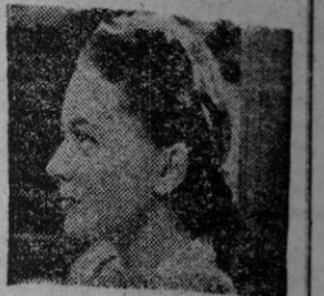
OLIVIA DE HAVILLAND

Olivia de Havilland no viene a decir que le encantaría trabajar en España. Viene a trabajar en España: «La princesa de Eboli». Greer Garson tiene aquí a su mari-