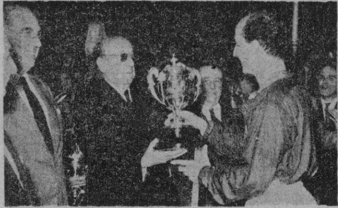
El Delegado Nacional de Deportes, Conde del Alcázar de Toledo, entrega la Copa del Campeonato del Mundo de Hockey sobre patines al capitán del equipo español