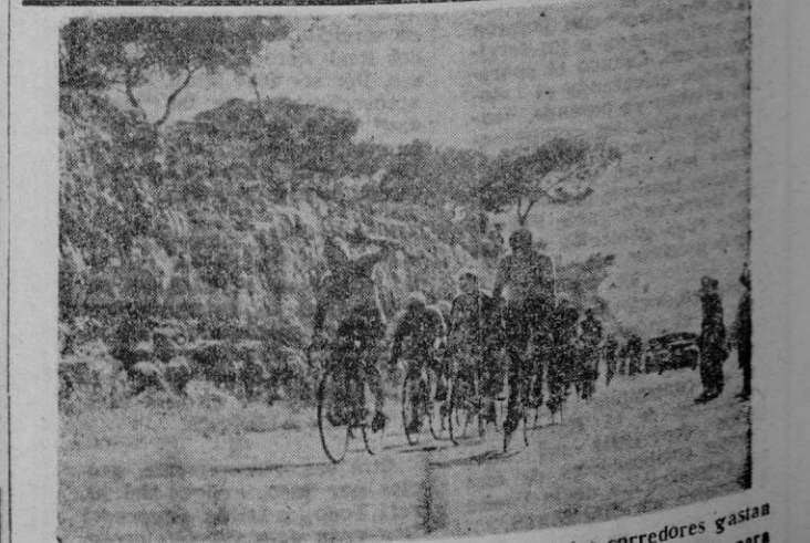
A todo sol se sube la cuesta de Algaida, mientras los corredores gastan un esfuerzo entusiasta. Uno de ellos se ayuda con un trago, para aliviar el camino.