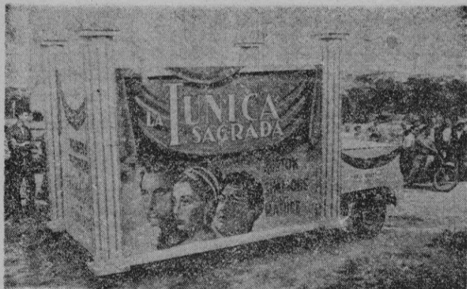
Se ha vuelto a incorporar una de las carrozas que tuvo que abandonar por accidente: la de la Sala Augusta, con su famosa película destinada al cinemascope.