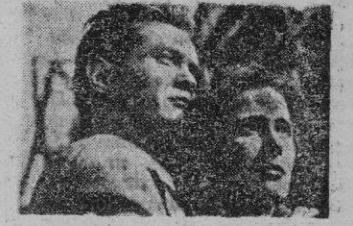
Una escena del film

Alemania, concretamente su capital, Berlin, con sus zonas de ocupación ha servido desde que finalizó la última contienda internacional a esta parte de escenario natural para distintas películas de espionaje y contraespionaje. Han sido llevados al celuloide diversidad de episodios acaecidos la mayoría de ellos, o por lo menos todos verosímiles como con frecuencia de la ocupación de la capital germana y la actitud entorpecedora soviética. Toda esta exposición de sucesos, generalmente fué llevada al cine por los norteamericanos. Pero una faceta de ese Berlin de la Posguerra había, digamos, sido soslayado. La actuación policial frente a la falsificación de moneda americana, cuyo hecho delictivo realiza una importante banda de molhecheros, el tema de "La huella conduce a Berlin" que costó a un relato apasionante en el que se nos ofrece fotografías magistralmente de los secretos subterráneos del Reichstag, hay muchos planes excelentes, que están tomados en las calles de la capital alemana, en los sectores oriental y occidental. La cámara gira con habilidad, logrando secuencias altamente emotivas, tales como distintas persecuciones de los falsificadores de dólares por la Policía, bien huyendo en veloces automóviles o por los subterráneos.