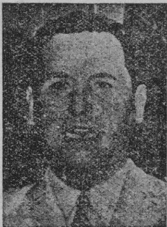
El Presidente Perón, cuya política obrerista y revolucionaria vive unos momentos de dificultades provocadas por la propia lucha social