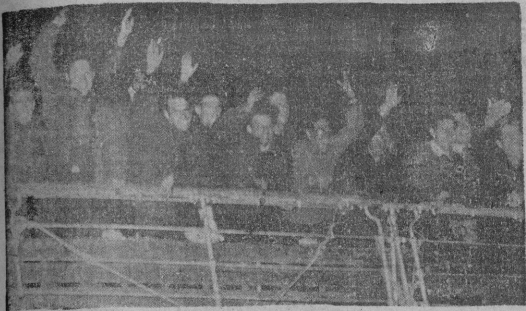
Los primeros saludos con destino a España. Estos son los heroicos ex-divisionarios y españoles prisioneros de Rusia que retornan a España después de más de diez años de cautiverio. Saludan jubilosos a bordo del "Semiramis", que les devuelve a la Patria.