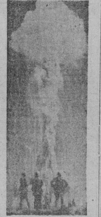
ria, la bomba H puede ser 700 veces más potente que la de Hiroshima.

en donde nuestro personal, al complacer al público, se complace a sí mismo.