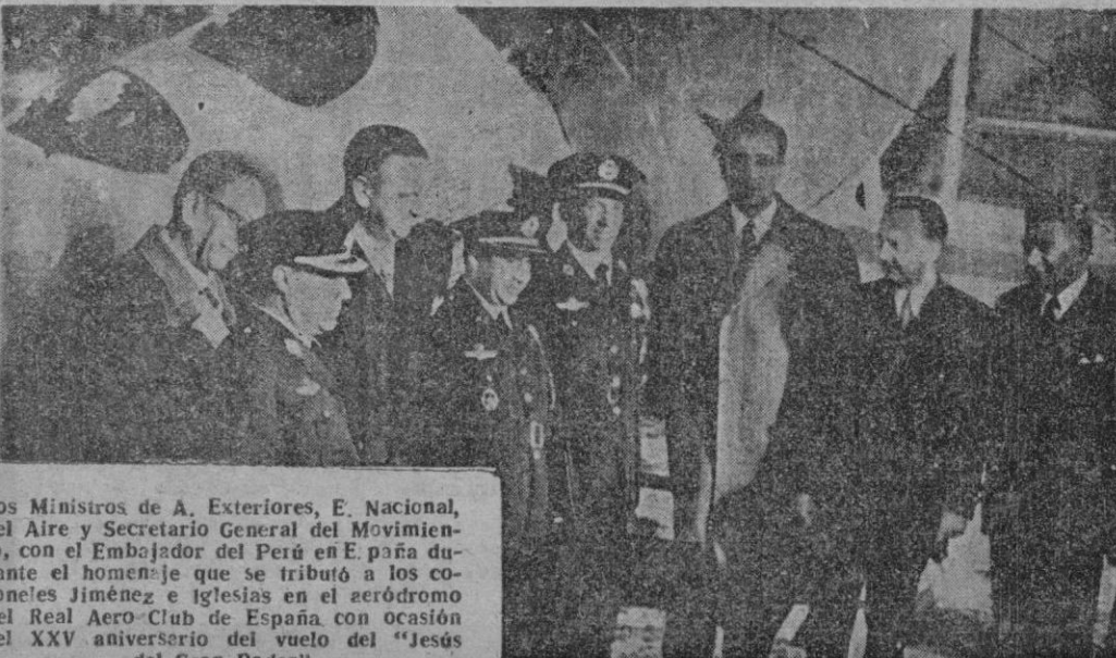
Los Ministros de A. Exteriores, E. Nacional, del Aire y Secretario General del Movimiento, con el Embajador del Perú en España durante el homenaje que se tributó a los coroneles Jiménez e Iglesias en el aeródromo del Real Aero Club de España con ocasión del XXV aniversario del vuelo del "Jesus del Gran Poder"