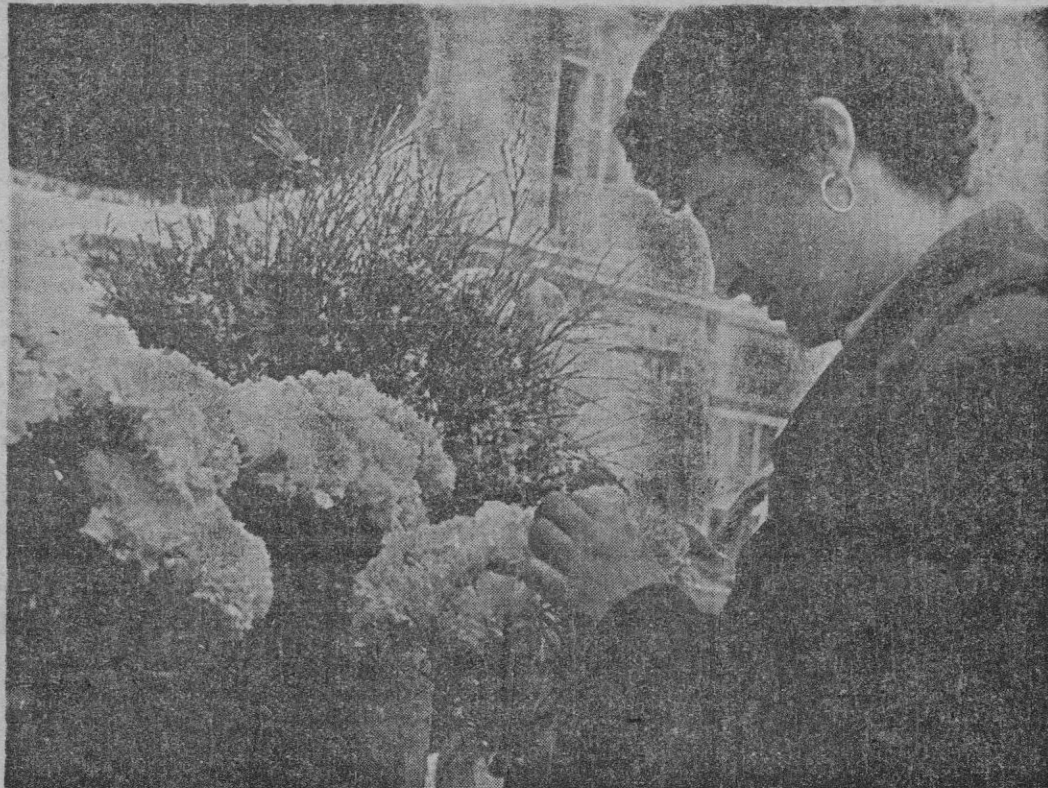
UNA FLORISTA PALMESANA