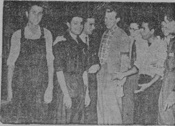
Aprendices de siete países confraternizan en la gran Olimpiada del Trabajo.

delineante, encuadernación, proyectistas de litografía, estereotipia, ebanista, carpinteros de mar, y tallistas en madera, más