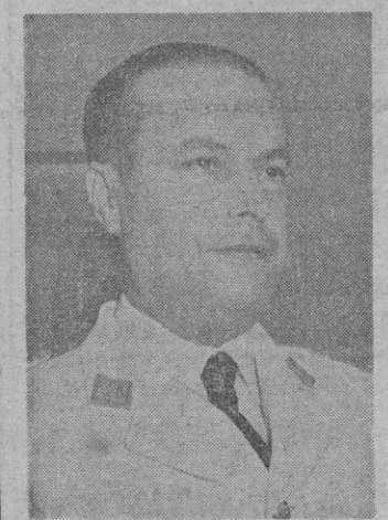
Don Blas Pérez González, Ministro de la Gobernación, que ayer defendió brillantemente el proyecto de Ley de Bases de Administración Local

El Presidente de las Cortes, don Esteban Bilbao, pronunció un discurso en el que dijo que el Gobierno español ya se hizo eco en muchas otras ocasiones del drama de los países soviéticos. "En tantos Gobiernos y Parlamentos,