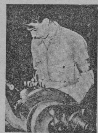
Aprendiz suizo en un momento de la competición