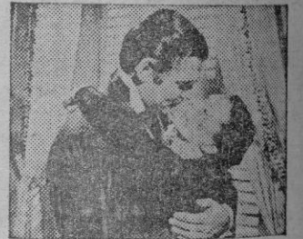
Una escena de "Lo que el viento se llevó"

—Existen varios métodos, o según el contrato. Yo puedo decir