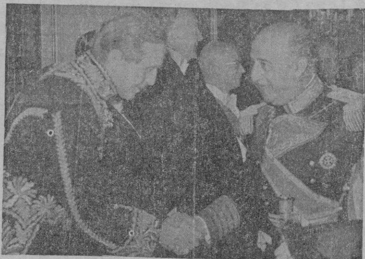
Los diplomáticos rinden pleitesía al Caudillo, creador de la España internacionalmente considerada de nuestros días.

mos que emplearnos a fondo, archivando devaneos y frases, si queremos sobrevivir del zarzal y el jaramago; que tengamos que mejorar la heredad si queremos que en el mundo se nos mirara como algo más que como una buena familia venida a menos de esas