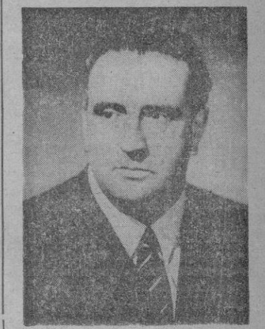
El Ministro de Asuntos Exteriores, señor Martín Artajo, que pronunció un importante discurso sobre los Acuerdos con los Estados Unidos

Los palabras finales del señor (Continúa en cuarta página)