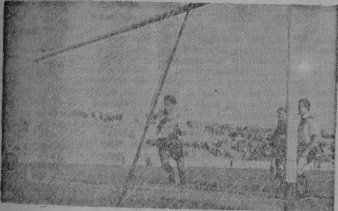
El remate de cabeza de Orfila, después de dar el balón en el poste, se convierte en el gol del empate para los mallorquinistas.