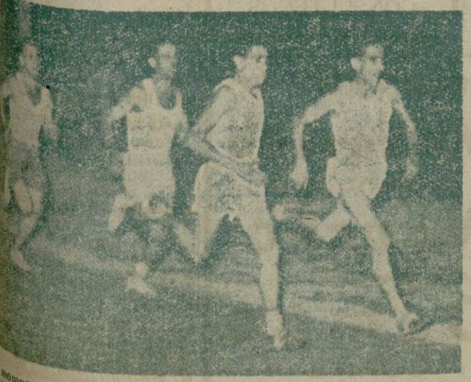
momento de las interesantes pruebas de atletismo disputadas en el Canódromo Balear en la tarde del domingo, en las que intervinieron los campeones de San Juan y del Hispania, que fueron presenciadas por numerosísimo público y en las que resultó vencedor el primer premio. Al parecer existe el proyecto de continuar disputando pruebas atléticas en aquel recinto.