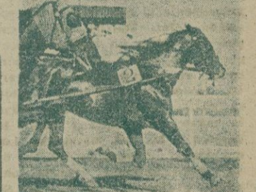
«Rubi», la yegua de Luchmayor, ganadora de la primera carrera, venciendo a «Tobac», por medio largo.

Seis caballos que valieron por doce. Hay 3 premios y todos merecieron clasificarse. «Vincennes» seguro y rápido estuvo siempre en cabeza y por último «Inpetto» y luego «Royal» y «Vinga» consiguieron igualarle. Fue una gran carrera. «Titán M» en alarde de facultades y a velocidad vertiginosa alcanzó el pelotón al