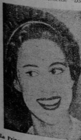
La Princesa Margarita quien, en unos pocos días, se ha hecho mundialmente popular.

PARA los súbditos ingleses en el sur de Africa, las princesas han de ser y comportarse de manera distinta a como lo hacen las demás personas. El título debe obviarles, y lo que en otras mujeres pudiera parecer hasta normal, ellas, por su recato y responsabilidad, deben rehúrlas. Una revista puritana de Africa del Sur, decía refiriéndose a la princesa Maravita: «Es verdaderamente insolito que una mujer joven de la Casa Real reconozca así, públicamente, una costumbre tan monstruosa. Nuestras muchachas no tardarán en deducir que fumar, se ha convertido en gusto normal. Y con el beneplácito real tratarán de implantar la moda». A este ataque periodístico responde el diario londinense «Daily