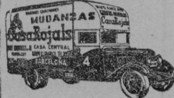
MUDANZAS CONSULTE PRECIOS Calle Esquinas 5. Tel. 2227-Palma

LOS MAS FAMOSOS VINOS TINIOS BANDA AZUL VINA VIAL GRAN RESERVA 1928 PIDALOS EN TODAS LAS BODEGAS