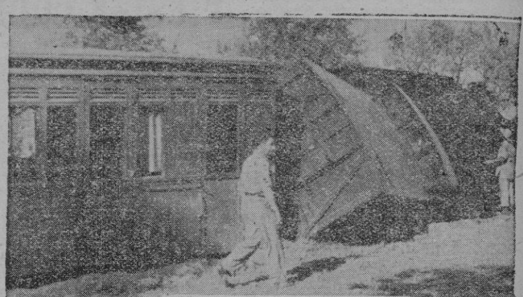
En este estado quedó el tren correo núm. 74 al ser embestido por un camión en las proximidades de Luchmayor

de precio sobre los motores a gasolina puede usted obtener un motor a gas-oil marca "JOS-MAN" desde 4 a 15 HP. Existencias en recambios para motores Vallino, Moessa y Vellino B. Socias. Calle Ancha 67-Teléfono 19. La Puebla