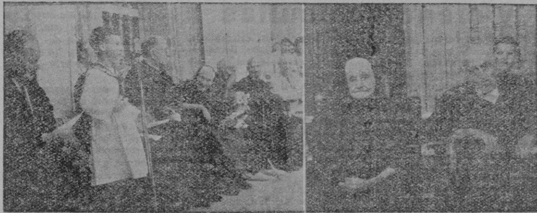
Dos momentos de la fiesta dedicada a la vejez en La Soledad.