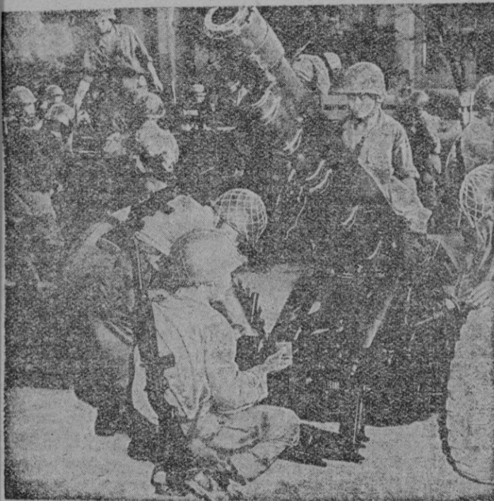
Instrucción de los soldados surcoreanos

El viejo político coreano, Rhee — un pretendido «criminal de guerra» para el Pentágono — ha sido también juzgado a la ligera por el imponente Mr. Churchill, con irónicos comentarios «de oídas» acerca de violaciones. Syngman Rhee, que ha sabido ser el mejor humorista de los tiempos actuales poniendo en libertad a 27.000 prisioneros anticomunistas, no ha tardado en contestar al «premier» inglés con acento nada suave.