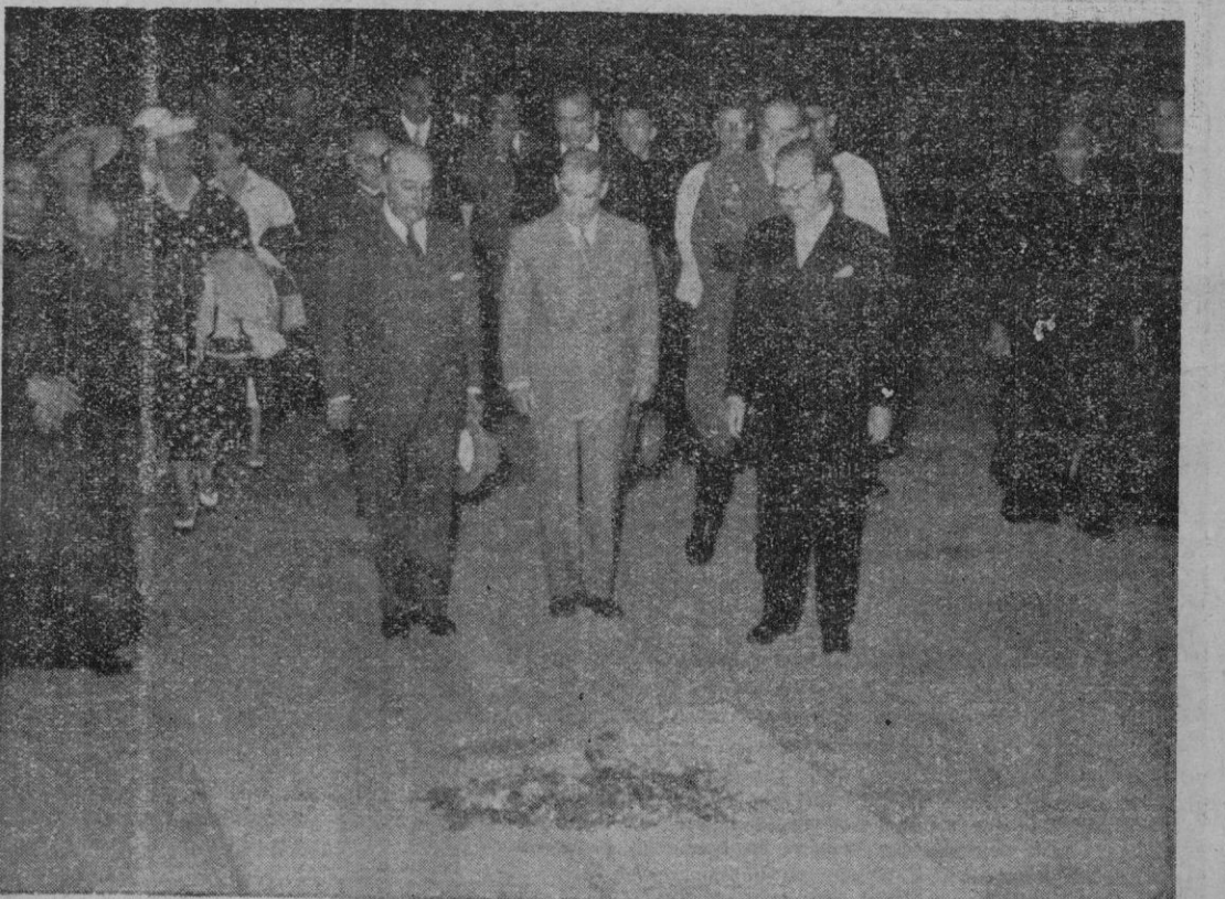
EL ESCORIAL. — Su Excelencia el Jefe del Estado español y el Presidente de la República portuguesa con las personalidades de su séquito, ante la tumba de José Antonio, durante su visita a la Basílica.