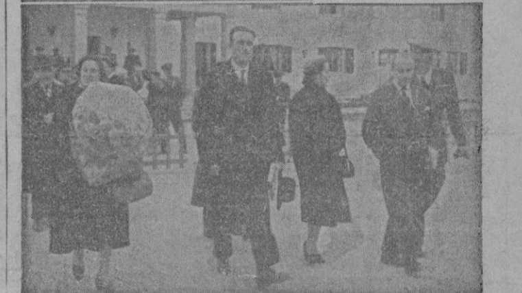
DOS momentos de la despedida del Ministro de Educación Nacional de nuestra tierra, El Excmo. Sr. D. Joaquín Ruiz Jiménez salió para Madrid, en avión, a las 3'45, siendo cariñosamente despedido por nuestras primeras autoridades.