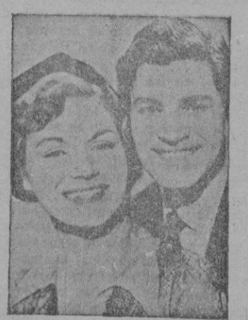
Una escena del film.

Sobre este tema Mario Zampi ha dirigido una encantadora película cómica, interpretada con el mayor rango por un conjunto de excelentes actores, que se mantiene, desde la primera hasta la última escena, dentro los márgenes de más puro humor. "Risa en el paraíso" no es, precisamente, una película "cacharrante", no hay en ella ni golpes, ni caídas, ni chistes chuscos, al contrario hay abundancia de ingenio de buena ley, unos intérpretes prodiuosos y una aura de humor—muy británico si se quiere—empapándolo todo.