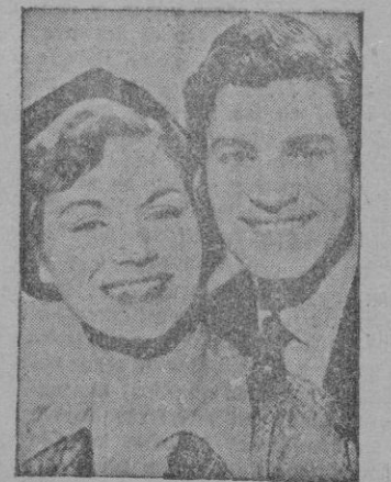
Una escena del film.

Sobre este tema Mario Zampi ha dirigido una encantadora película comica, interpretada con el mayor rango por un conjunto de excelentes actores, que se mantiene, desde la primera hasta la última escena, dentro los márgenes de más puro humor. «Risa en el paraíso» no es, precisamente, una película adre-