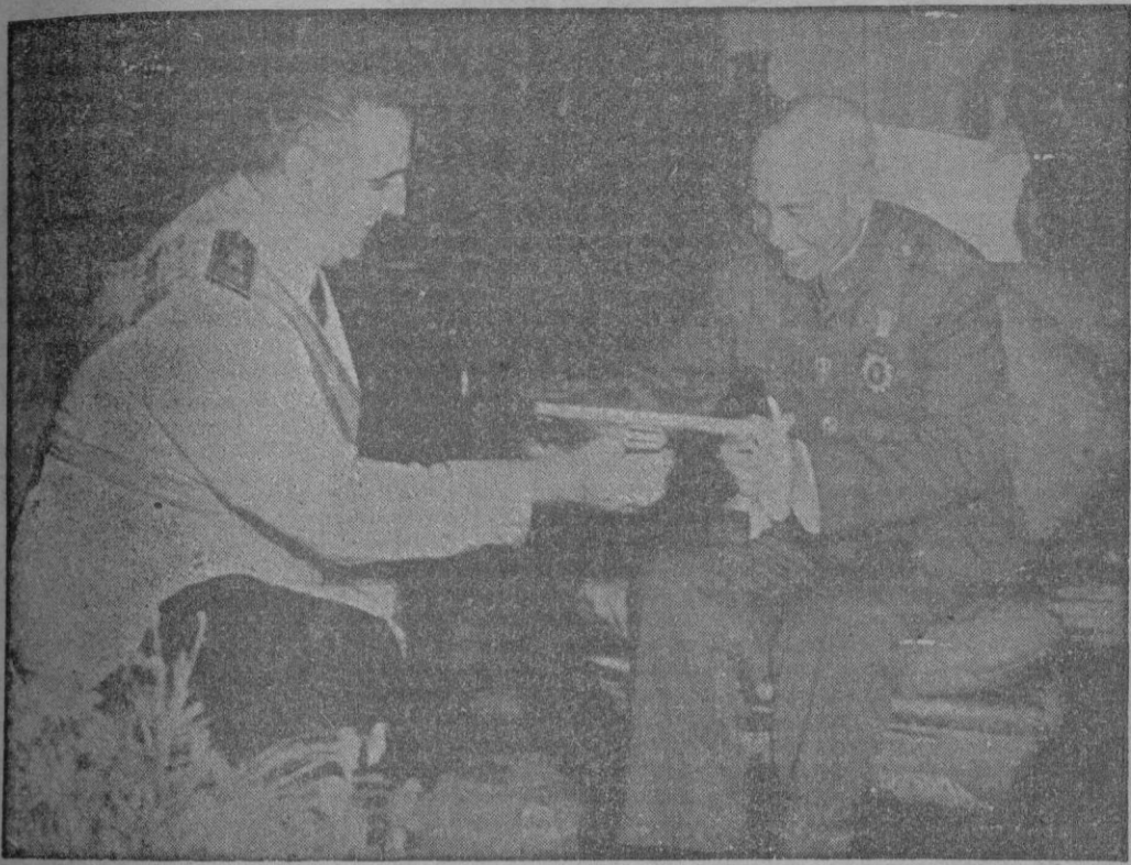
TAIPEH. — El ministro español de Asuntos Exteriores, señor Martín Artajo, hace entrega al Generalísimo Chang Kai Chek de un retrato dedicado de S. E. el Jefe del Estado español, durante la visita del primero a la capital de Formosa.