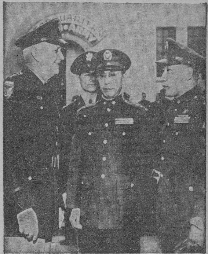
SAN FRANCISCO. — En el centro, el teniente General Hsu Pei Kan, ayudante del Jefe del Supremo Estado Mayor y el Mayor General Chiang-Wei-Kuo, hijo del Mariscal Chiang Kai-Shek, a la derecha, conversan con el general Joseph Swing, jefe del 6.º Ejército, durante la revista celebrada en honor de dichos generales chinos que visitan las instalaciones del Ejército norteamericano bajo los auspicios del programa de Defensa y Asistencia Mutua.

GENERALES DE LA CHINA NACIONALISTA EN NORTEAMERICA