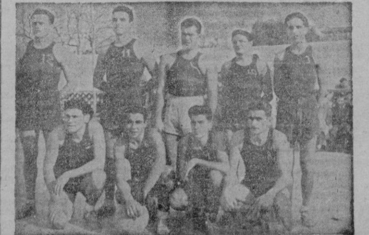
Equipo del «Club Barcelona», que al vencer el pasado domingo al «Excelsior», ha hecho aumentar el interés de la última jornada del campeonato regional de baloncesto en su primera categoría.