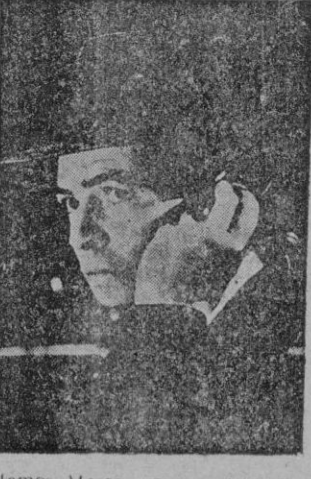
James Mason en una escena.

Olvidando el valor documental de la cinta, que relata, con relativa fidelidad, unos hechos en forma de espionaje más escandaloso de la última guerra, sepamos de esto.