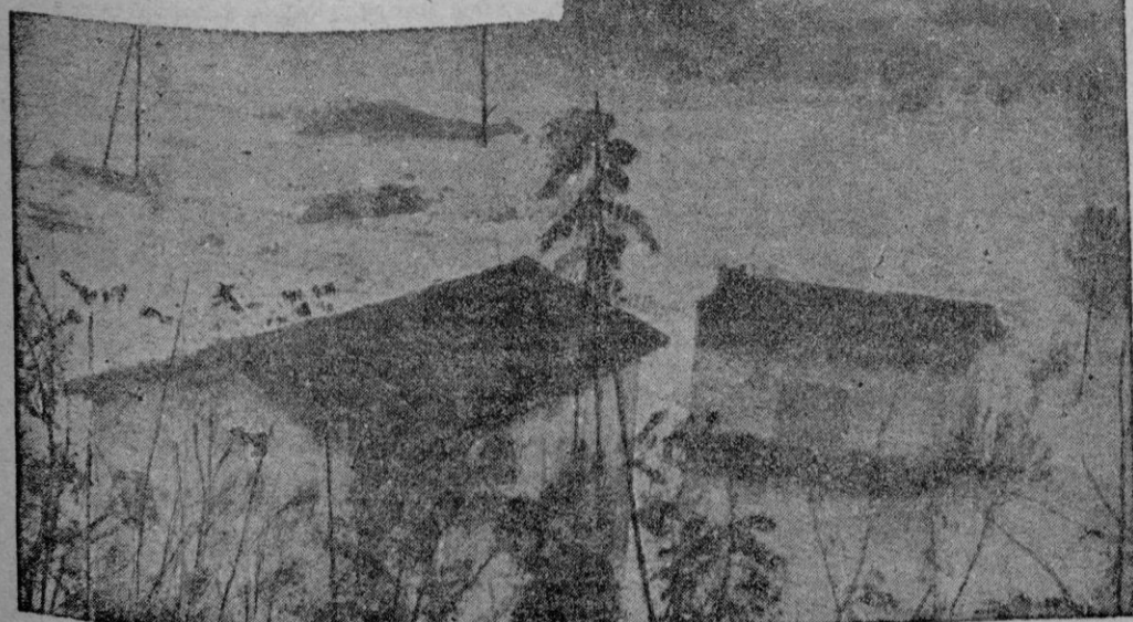
Unas mil doscientas hectáreas de terreno han quedado inundadas por el desbordamiento de los ríos a consecuencia de los últimos temporales en Italia. Una vista de las inmediaciones de Comasanto indica la intensidad de la riada