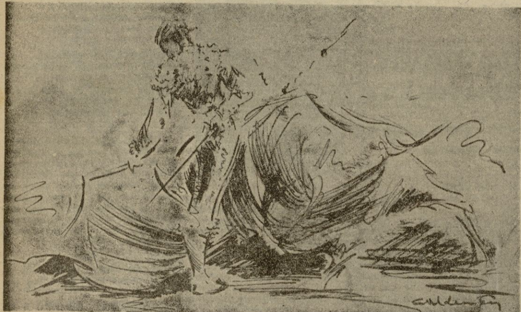
Así torea al natural "Antoñete"

¿Por qué no le dieron el apote de lucas a Chenel antes de empezar la corrida? QUINTO