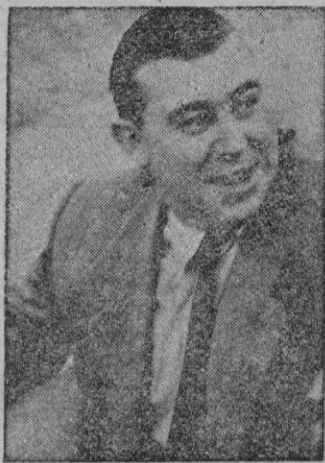
Sa que siento mucho, pero no quiero "foto".

Lo sentimos doctor. En el mo- mento de decirnos esas palabras "Juanet" ya había disparado su "Leika", y cuando nuestro fotó- grafo hace una "foto" hay que pu- blicarla a la fuerza. Además de esta forma nos que- daba completado el "trío de tur- no".