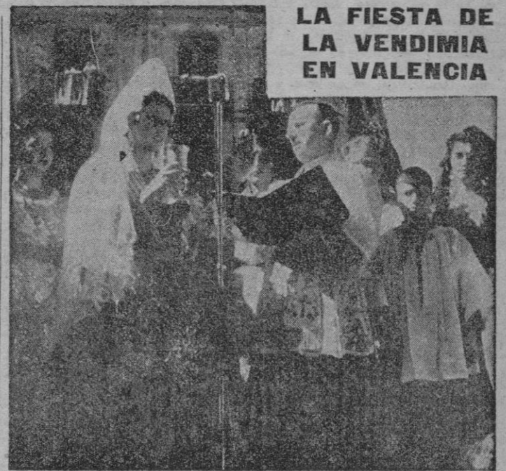
LA FIESTA DE LA VENDIMIA EN VALENCIA

Segovia, 16. — Durante la ceremonia religiosa, el Coro interpretó una misa en canto gregoriano, y en el momento de la Consagración (Continúa en tercera pag.)