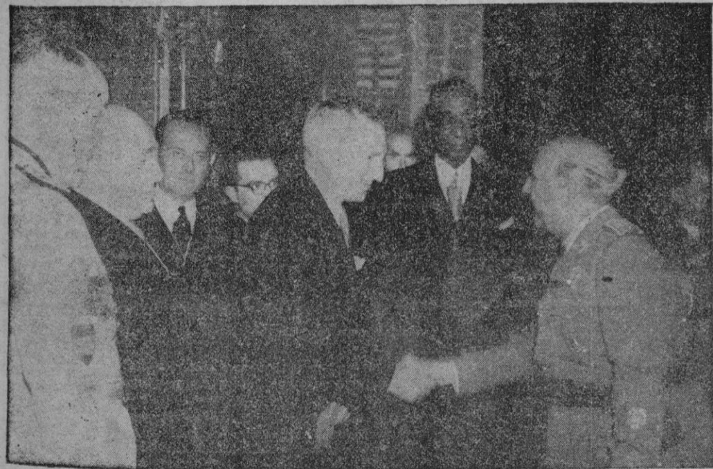
Granada. — Ante las incansables aclamaciones de la multitud, S. E. el Jefe del Estado, Generalísimo Franco, llegado a esta ciudad para presidir la clausura del V Centenario de los Reyes Católicos, hubo de salir al balcón del Ayuntamiento y dirigir un saludo, momento que recoge la fotografía superior. Y S. E. el Jefe del Estado, Generalísimo Franco, saluda a las representaciones del Cuerpo Diplomático asistentes también a estos actos. En la foto de la mano a Mac Veagh.