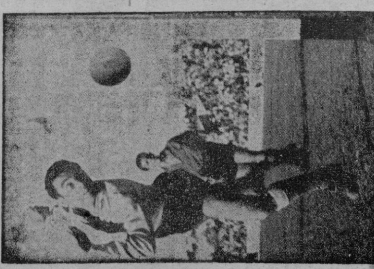
ESTE pudo ser y no fué el gol que diera la victoria al "Mallorca". La suerte salvó a González, del Melilla, de ver irremisiblemente hecho y desecho este gol... que no lo fué. (Información deportiva en nuestro Suplemento.)