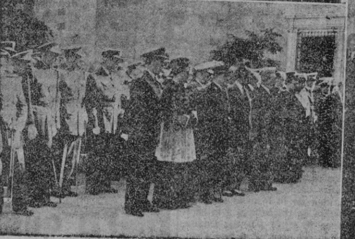
1.º foto: Las autoridades militares y civiles salen de la iglesia de la Merced, donde tuvo lugar misa organizada por el cuerpo...