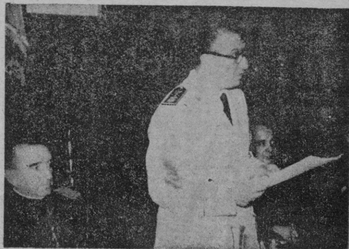
BILBAO. — El Ministro de Justicia pronuncia la primera lección en el acto inaugural de curso en Deusto.