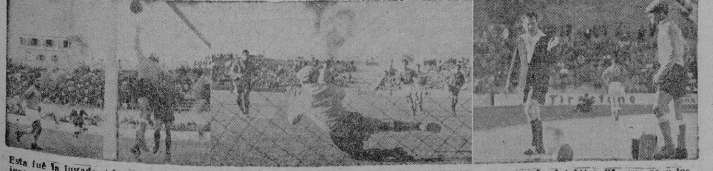
Esta fué la jugada del gol que "fué y no fué". ¿Entró? ¿No entró? Los que podían apreciarlo dicen que sí, el árbitro dijo que no y los jueces de línea, ni se enteraron. Otra vez será. — Y así detuvo el portero melillense el penalty con que castigó a su equipo el árbitro Tamarit. — Una muestra de la nueva medicina cura lesiones, la prueba de Irelaj que Tamarit aplicó con prodigalidad el domingo en "Es Forti".