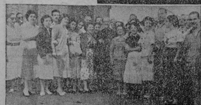
La Capella Clásica rinde a su creador y Director, en el feliz regreso a Mallorca.

(En páginas interiores publicamos más información del arribo de Mn Tomás)