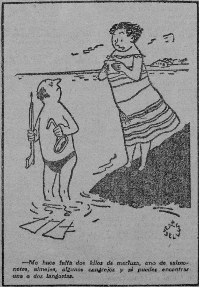
—Me hace falta dos kilos de merluza, uno de salmónes, almejas, algunos cangrejos y si puedes encontrar una o dos langostas.