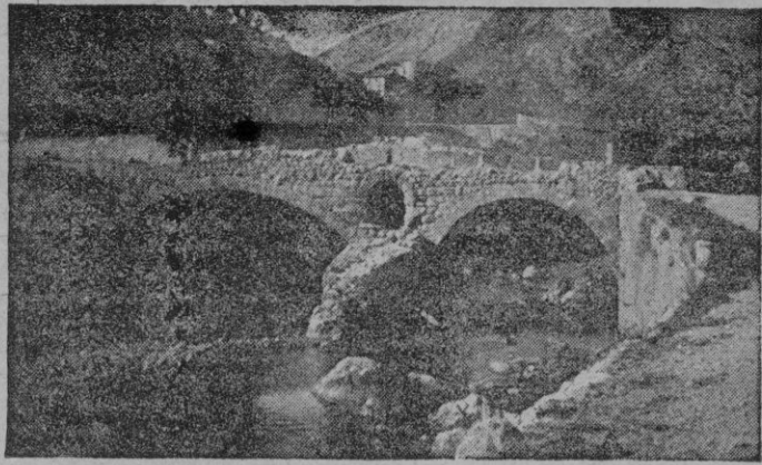
Vestiges de la domination romaine: le Pont de Pollensa