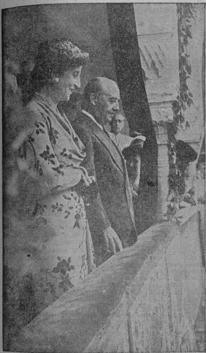
San Sebastián. — S. E. el Jefe del Estado y su esposa corresponden a las aclamaciones del público, a su llegada a la Plaza de Toros para presenciar la cuarta corrida de abono.

S. E. EL JEFE DEL ESTADO Y SU ESPOSA EN LOS TOROS