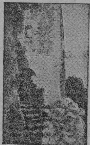
It is the castle of Alaró which has given the town its chief distinction in Majorcan history.

When young Alfonso of Aragon, in support of his father enmity against James II, invaded the island and deposed his uncle, he has little different castles and made a show of resistance, they soon surrendered.