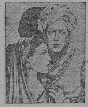
Una escena de la película

ASTORIA Y AVENIDA Anteayer se proyectó la nueva versión española, el "Tigre de Esnapur".