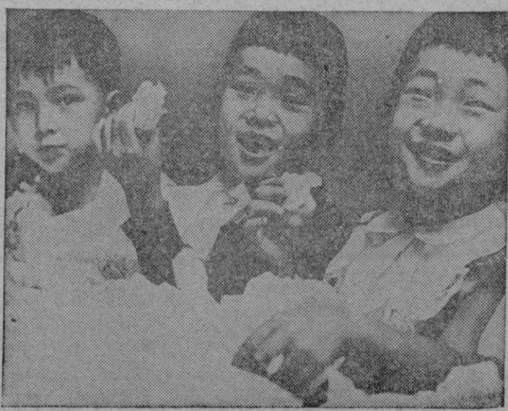
Rostros felices los de la chiquillería que no conoce los pactos ni los organismos de consoliación, y, sin éstos, tampoco lo que es ni la paz ni la guerra, que bien mirado, son cosa igual hoy día. Ellos tienen su gran dicha: la inocente juventud.