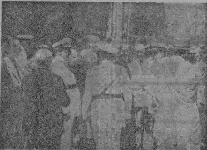
Nuestras primeras autoridades, a la salida de la iglesia de la Concepción

En la iglesia de la Concepción a las 11:30 de ayer se celebró solemne misa en sufragio de los fallecidos del Arma de Caballería coincidente con la festividad de Santiago Apóstol, Patrón de España y de la caballería española.