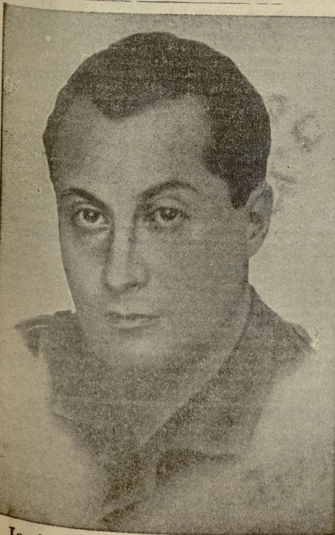
José Antonio Primo de Rivera