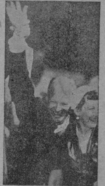
CHICAGO. — Momentos después de la Convención celebrada en esta ciudad, Eisenhower, acompañado de su esposa, saluda alborozado a los miembros de la Convención.