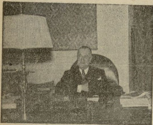
CONDE DE VALLELLANO, Ministro de Obras Públicas

EL Ministro de Obras Públicas, señor Conde de Vallengano, ha recibido en su despacho oficial a un redactor de la agencia CIFRA, al cual ha hecho interesantísimas declaraciones relacionadas con la labor de su Ministerio. A las preguntas