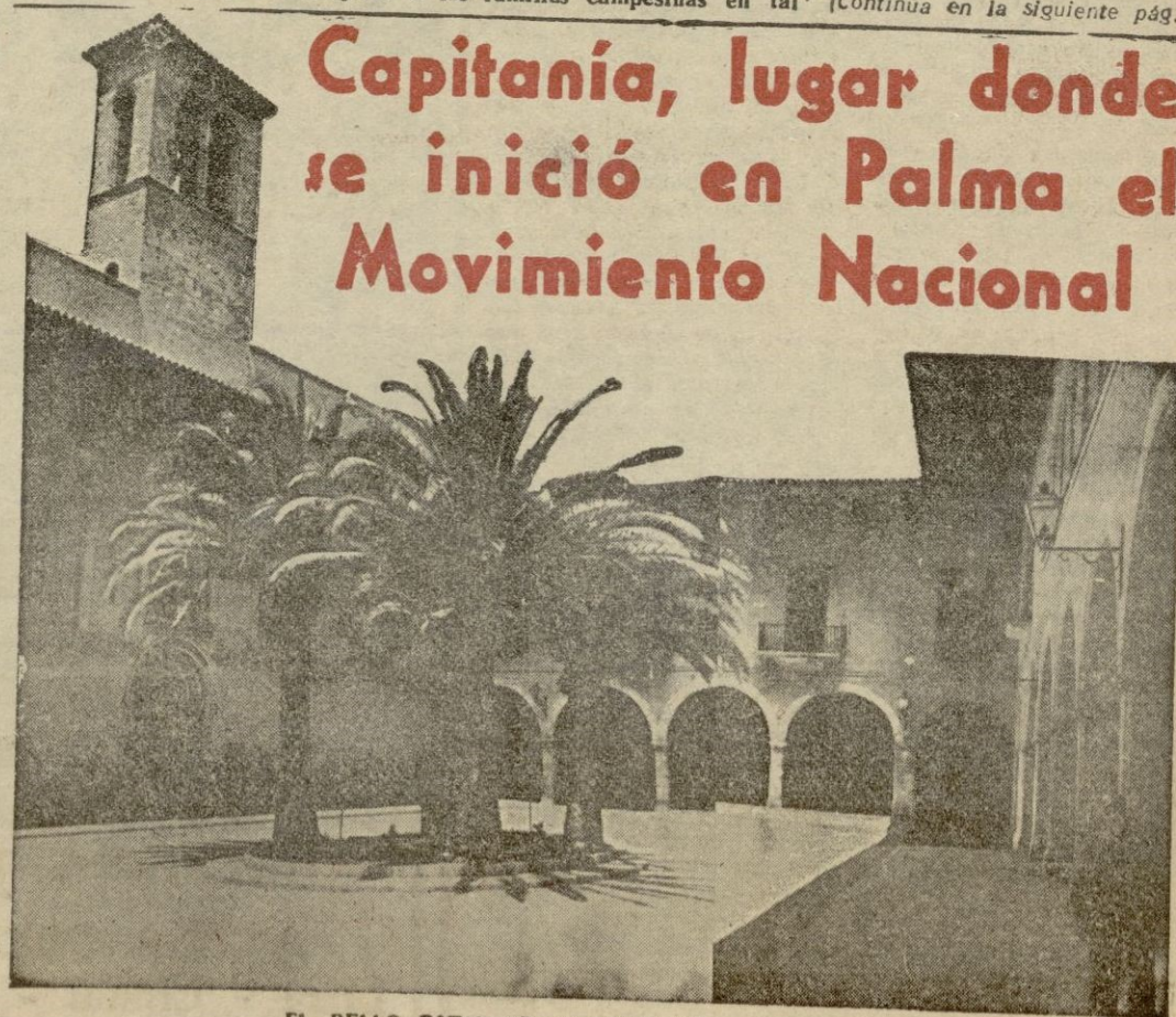
EL BELLO PATIO DE LA CAPITANIA