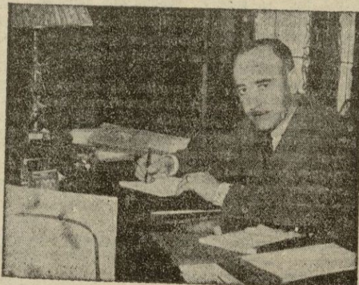
Don RAFAEL CAVESTANY, Ministro de Agricultura

—Ha constituido preocupación preferente de este