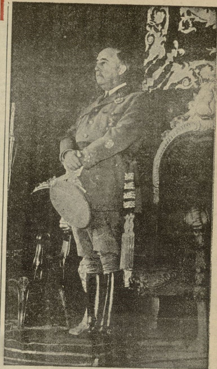
S. E. el Jefe del Estado