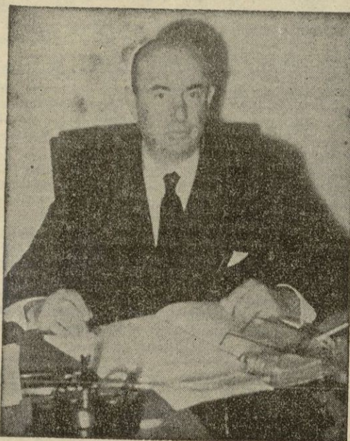
Don MANUEL ARBURUA, Ministro de Comercio

Las relaciones comerciales con Liberia van a ser también ampliadas de manera muy considerable, y parece seguro que importantes empresas españolas