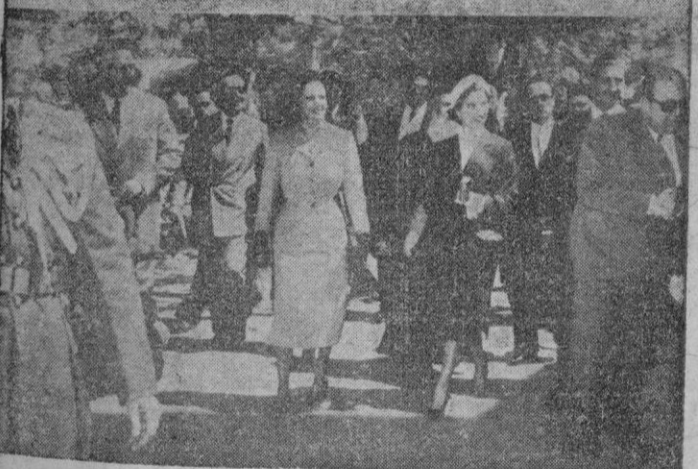
Arriba: La marquesa de Villaverde — derecha — conversando con destacadas personalidades de la vida libanesa durante su estancia en Beirut con la misión española. — Abajo: Los marqueses de Villaverde con el ministro de Asuntos Exteriores, señor Martín Artajo y su esposa y otros miembros de la misión española, a su llegada al Santuario de Nuestra Señora del Líbano, en Harissa, donde fueron acompañados por el hijo del Presidente de la República, Cheik Kalil El Khoury, y el ministro de España en Beirut.